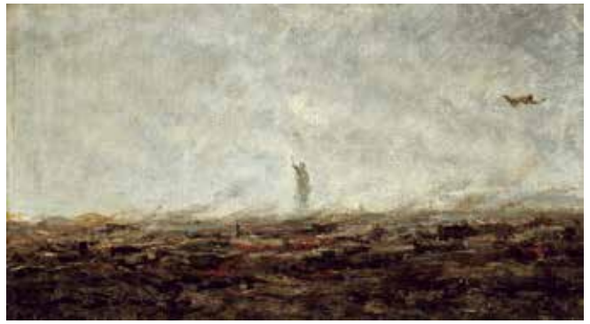
fig.17 カミーユ・コロー《夢、燃えるパリ、1870年9月》1870年頃、油彩・カンヴァス、 30.5×54.5cm、パリ、カルナヴァレ美術館 Camille COROT, The Dream, Paris Burning, September 1870 , c.1870, Musée Carnavalet, Histoire de Paris

頃、アーティゾン美術館) (fig.15)とモリゾの《ノルマンディの農場》(1859-60年頃、個人蔵) (fig.16)を見れば、モリゾがその画業の最初期より風景画における空間構成をコローに学んでいることがわかる。モリゾがマネと出会って後、モリゾへのマネの関わりと影響が強調される中で、コローとモリゾの関わりと影響をどう考えるべきか。コローの絵画の様式は明確にモリゾの絵画に息づいている 20 。