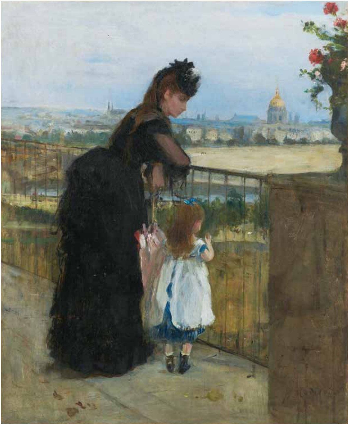
fig.1 ベルト・モリゾ《バルコニーの女と子ども》1872年、油彩・カンヴァス、61.0×50.0cm、石橋財団アーティゾン美術館 Berthe MORISOT, Woman and Child on the Balcony , 1872, Artizon Museum, Ishibashi Foundation, Tokyo