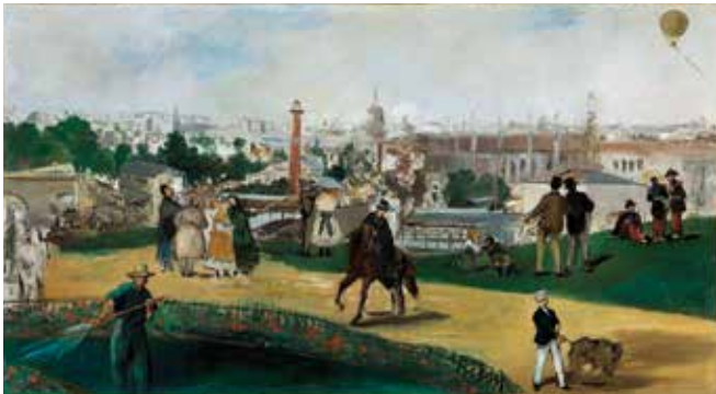
fig.10 エドゥアール・マネ《1867年の万国博覧会の眺め》1867年、油彩・カンヴァス、108×196cm、オスロ国立美術館 Edouard MANET, View of the 1867 Exposition Universelle , 1867, The National Museum, Oslo

年、サンタ・バーバラ美術館 (fig.9) を描いている。人物は共通するモチーフでありながら、構図への配置は異なる。しかし円形に見える景色はよりワイドではあるが両者はほぼ一致する。この絵に先行して、マネが《1867年の万国博覧会の眺め》(1867年、オスロ国立美術館) (fig.10) を描いていることは大変重要な事実と思われる。なぜならジャン＝ド＝マルスが万国博覧会場となっているか否かの差はあれ、横長の空間にプランを重ねていく構図は、両者に共通する遠近表現となっているからだ。円形のパリ市街の光景も、モリゾのそれがやや左を向いている以外は、モチーフは一致している。《バルコニーの女と子ども》は、それに同様な場所から描き、遠景に描かれた市街の建築のモチーフはところどころ一致するものの、構図は決定的に異なる。風景画の手前に大胆に人物を配するイメージはとても大胆で、奥行きのある空間構成を実現している。そして作品は、風景画であるとともに、人物画あるいは風俗画としての質を獲得しているのだ。