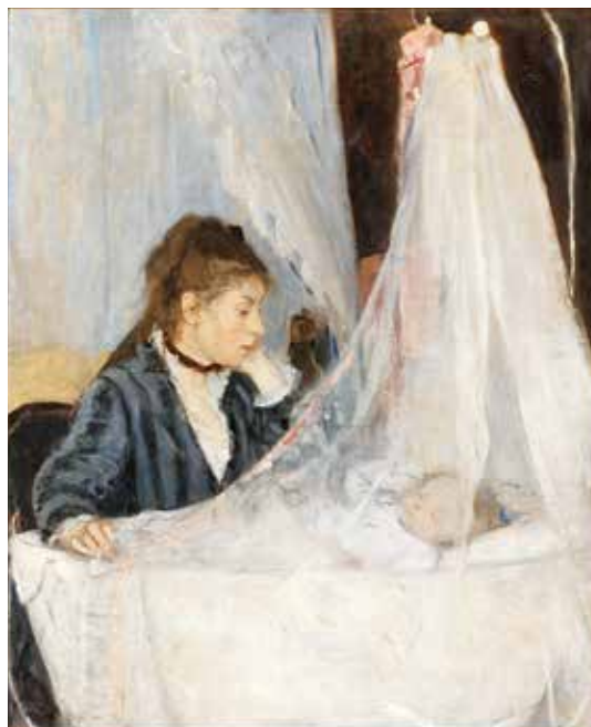
fig.7 ベルト・モリゾ《ゆりかご》1872年、油彩・カンヴァス、 56×46cm、パリ、オルセー美術館 Berthe MORISOT, The Cradle , 1872, Musée d'Orsay, Paris

この作品には、およそ3分の1のサイズの同じ構図・彩色の水彩画《バルコニーにて》(1871-72年、シカゴ美術館)(fig.8)が存在