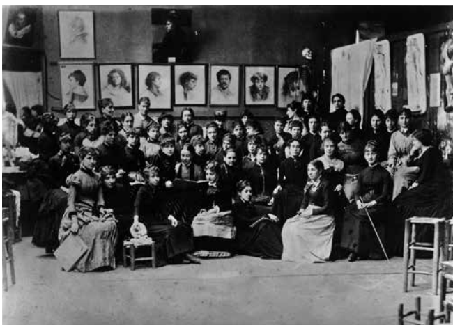
fig.5 アカデミー・ジュリアン、1889年 Académie Julian, 1889

ベルト・モリゾは1841年1月14日にブルジュに生まれた。ブルジュ市でシェール県官吏の父と、ロココ美術の巨匠フラゴナールの遠縁にあたる母の間に生を受けた。父親はシェール県知事をはじめ要職を歴任した後、一家で1852年にパリへと引っ越してきた。モリゾはそれ以来生涯のほとんどをパリで過ごしている。父親はかつて建築家を志し、母親は音楽家を夢見たこともあり、経済的、芸術的にも比較的豊かな環境の中で育った。1855年、モリゾ14歳の時、母親は父親の誕生日の贈り物に娘たちの絵を贈ることを考え、彼女たちを画家アルフォンス・ショカルヌのもとに連れて行った。これを契機にエドマとベルト