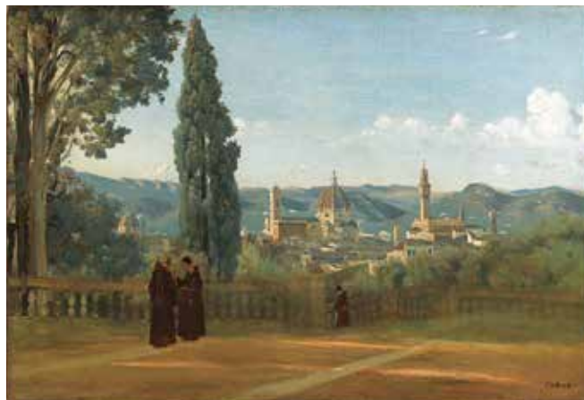
fig.12 カミーユ・コロア《ポーポリ庭園から見たフィレンツェの眺め》1835-40年頃、油彩・カンヴァス、51×73.5cm、パリ、ルーヴル美術館 Camille COROT, View of Florence from the Boboli Gardens , c.1835-40, Musée du Louvre, Paris

ところで《トロカデロからのパリの眺望》は、確かにマネの《1867年の万国博覧会の眺め》との類似点が見いだせるが、風景表現として、マネにもモリゾにも先行するジャン=バティスト・カミーユ・コロアの市外の高台から見た都市の眺望を描いた作品を想起させる。高台の柵越しに見える市街風景、というモチーフをコロアはしばしば描いており、たとえば《ポーポリ庭園から見たフィレンツェの眺め》(1835-40年頃、パリ、ルーヴル美術館)(fig.12)は、2人の作品に共通する構造を有している。また《ティヴォリ、ヴィラ・デステの庭》(1843年、パリ、ルーヴル美術館)(fig.13)も同じような構造を有しているが、モリゾは1863年にこの絵を模写した《ティヴォリの風景(コロアに基づく)》(個人蔵)(fig.14)を描いている。モリゾがコロアに師事し始めたのは1860年、19歳の頃。それからマネに出会う1868年頃までその師弟関係は続く。《オンフルールのトゥータン農場》(1845年