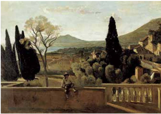
fig.14 ベルト・モリゾ《ティヴォリの風景(コローに基づく)》1863年、 油彩・カンヴァス、42×59cm、個人蔵 Berthe MORISOT, View of Tivoli (after Corot) , 1863, Private Collection