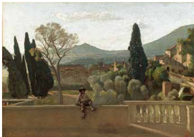
fig.13 カミーユ・コロア《ティヴォリ、ヴィラ・デステの庭》1843年、油彩・カンヴァス、43.5×60.5cm、パリ、ルーヴル美術館 Camille COROT, The Gardens of the Villa d'Este at Tivoli , 1843, Musée du Louvre, Paris