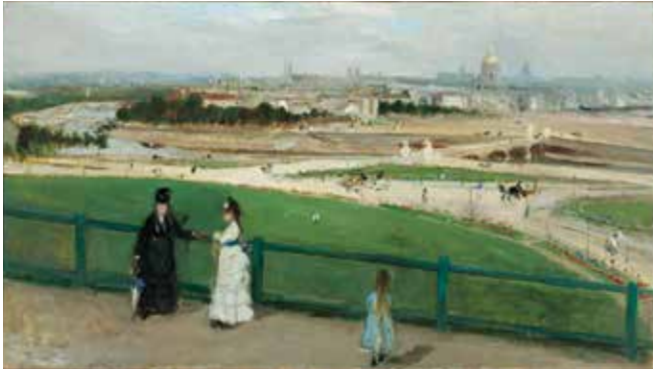
fig.9 ベルト・モリゾ《トロカデロからのパリの眺望》1871-73年、油彩・カンヴァス、46×81.6cm、サンタ・バーバラ美術館 Berthe MORISOT, View of Paris from the Trocadero , 1871-73, SBMA, Gift of Mrs. Hugh N. Kirkland, Santa Barbara Museum of Art