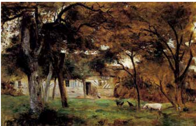
fig.16 ベルト・モリゾ《ノルマンディの農場》1859-60年頃、油彩・カンヴァス、 30×46cm、個人蔵 Berthe MORISOT, Farm in Normandy , c.1859-60, Private Collection