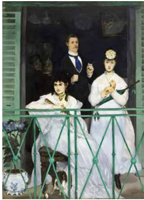
fig.6 エドゥアール・マネ《バルコニー》1868–69年、 油彩・カンヴァス、170×124.5cm、パリ、オルセー美術館 Edouard MANET, The Balcony , 1868–69, Musée d'Orsay, Paris

の姉妹は、絵画制作への関心を深め、1857年にはジョゼフ・ギシャルに師事することになった 7 。