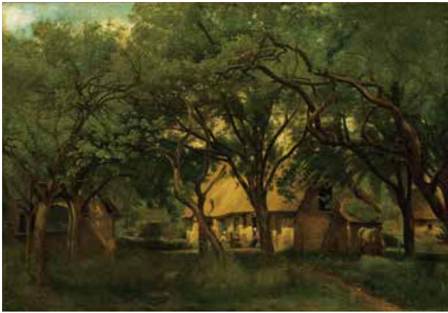
fig.15 カミーユ・コロー《オンフルールのトゥータン農場》1845年頃、 油彩・カンヴァス、44.4×63.8cm、石橋財団アーティゾン美術館 Camille COROT, The Toutain Farm at Honfleur , c.1845, Artizon Museum, Ishibashi Foundation, Tokyo