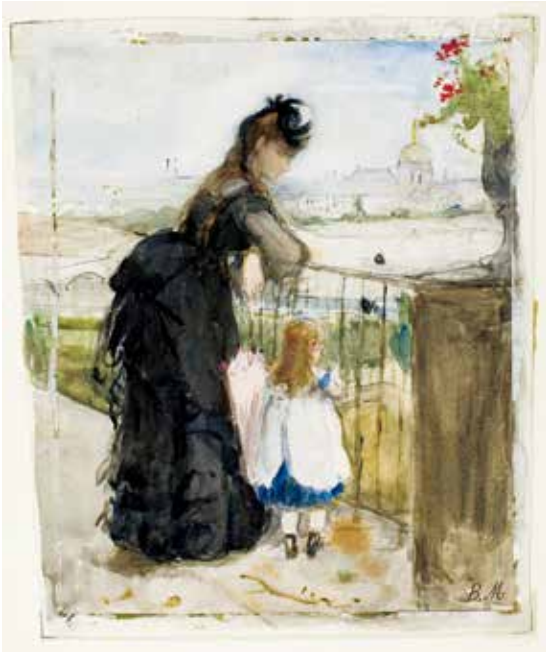
fig.8 ベルト・モリゾ《バルコニーにて》1871-72年、 水彩、グワッシュ、黒鉛・紙、20.6×17.3cm、シカゴ美術館 Berthe MORISOT, On the Balcony , 1871-72, The Art Institute of Chicago

する。スタッキーとスコットは、これは画家による油彩作品のための準備素描ではなく、油彩作品の複製だろう、と述べている。この時期、モリゾはマネがしばしばそうしたように、水彩画による「覚え」としてのスケッチを残しているという 12 。