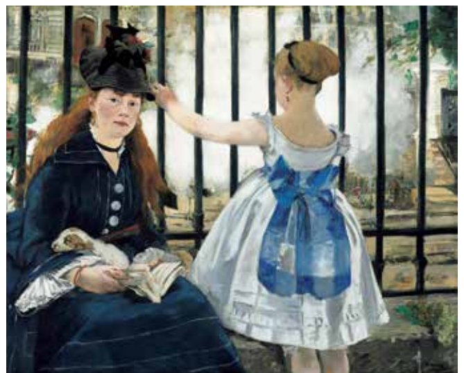
fig.11 エドゥアール・マネ《鉄道》1873年、油彩・カンヴァス、93.3×111.5cm、ワシントン・ナショナル・ギャラリー Edouard MANET, The Railway , 1873, National Gallery of Art, Washington / Gift of Horace Havemeyer in memory of his mother, Louise W. Havemeyer

モリゾが《バルコニーの女と子ども》を描いた翌年の1873年に、マネは《鉄道》(ワシントン・ナショナル・ギャラリー) (fig.11) を制作した。この作品でマネは、構図は異なるがモリゾのバルコニー