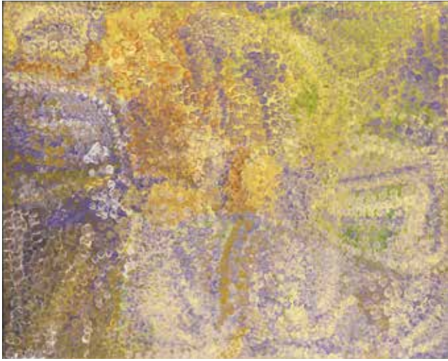
fig.2 エミリー・カーメ・イングワリィ《春の風景》1993年、 合成ポリマー・絵具・カンヴァス、 122.0×152.0cm、石橋財団アーティゾン美術館 Emily Kame KNGWARREYE, Spring Landscape , 1993, Artizon Museum, Ishibashi Foundation, Tokyo ©VISCOPY, Sydney & JASPAR, Tokyo, 2020 C3328

ワリィ (1910頃–1996) が挙げられる。当館所蔵作品《春の風景》(1993年、fig.2) はイングワリィが用いた手法が明確に見られる作品だ。この作品は、イングワリィの故郷アルハルゲラの大地を描いているが、画面全体に描かれた点描によって、対象は抽象化されている。アルハルゲラはイングワリィの精神世界と深く関係しているが、作品自体にそれを意味するデザインは一切含まれていない。こうした技法を、美術史家ヘティ・パーキンズは、文化的要素をもつ複雑なデザインをはぎ取り、主題の核心、骨子の部分を明らかにして描き、そして単純な線やマークがもつ優美さを視覚的に追求している、と分析する 6 。マラウィリィも、まさにこうした主題の抽象化を実践する作家である。つまりマラウィリィは、ヨルング・コミュニティの文化、氏族の象徴デザインの継承伝統とそれが意味する対象を尊重しながら、抽象化された線によってそれ以上の言及を避け、視覚的効果を優先し成功しているのである。そして《ボウンニュー》は、そうしたマラウィリィの伝統と革新が作品に同化することなく同時に表現されているのである。