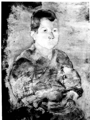
fig.3 《子供》の赤外線写真

ではどんな絵の上にこの作品は描かれたのであろうか。背景の青色の下層には肉眼でも白と朱の色相を確認出来るが、その形や構図を読みとることは困難であった。そこで赤外線テレビカメラを用いた観察を行うことによって、右から左に広がる扇状の「白い面」と、中央で画面を左右に分ける「境界線」が上部と下部に確認できた (fig.3)。先ほどと同じように今度はこの赤外線写真の左辺が下辺となるように90度回転させると、これらの「白い面」と「境界線」は、《神の祈り》(fig.4)をはじめとする他の作