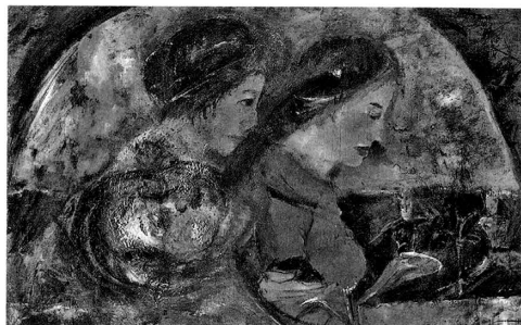
fig.5 関根正二《三人の顔》1918年頃、油彩、個人蔵

また、下層にあった元の二人の女性像は、ちょうど《神の祈り》の左右を反転した鏡像のようであり、構図も非常によく似ている。両者を比較すると、この作品の画面向かって左の女性像は《神の祈り》の右側の女性像と同じく手