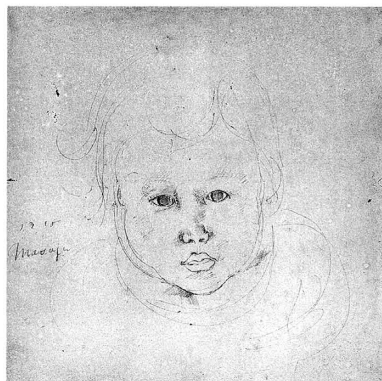
fig.7 関根正二《少女の顔》1918年、インク、 個人蔵

このうち、子供を描いた作品群で注目したいのはサインである。前述の《子供》のサインは masaji くまさじ」となっている。このたび初めて公開される作品群の中にも男児を描いたものが4点あり、そのうち3点にやはり masaji のサインがある。同じサインの入った作品はもう一点《少女の顔》(fig.7) という題のつけられているペン素描があるが、これも描かれているのは少女というより幼児である。1918年から19年にかけて、関根は集中的に子供、特に男児を描いていることになる。しかも、masaji サインはすべて男児または幼児の像である。《死を思う日》に Shoji Sekine というサインを入れて以来、つねにくしょうじ」を示す S. SEKINE という