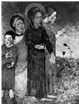
fig.8 関根正二《慰められつゝ悩む》の 絵ハガキ

関根の最後の油彩作品、《慰められつゝ悩む》は、1919年9月の第6回二科展に出品された後、関根家にあったが、関東大震災のときに一時避難のために持ち出されて以来、所在不明となっている。50号とも60号ともいわれるこの作品は、いま、二科展にあたって作製された絵ハガキ (fig.8) によってしかその図様と色彩を知ることができない。空を思わせる青を背景にして、アザミが咲く野原に立つ3人の女性と一人の少年を組み合わせた作品である。《慰められつゝ悩む》と《子供》は、色