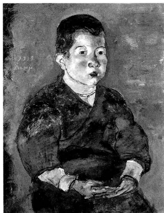
fig.1 関根正二《子供》1919年、油彩、 石橋財団ブリヂストン美術館

石橋財団ブリヂストン美術館が所蔵する関根正二の《子供》(fig.1)は、大きさ、縦60.9センチ、横45.7センチ。画面左上に「1919 / masaji」という年記と署名があり、1919年6月16日に20歳2カ月で肺結核により亡くなった関根の、最晩年の油彩作品であることを教えてくれる。前年9月、《信仰の悲しみ》(fig.2)、《姉弟》、《自画像》を第5回二科美術展覧会に出品した19歳の関根は、有望新人に与えられる樗牛賞を受賞する。それから一年経たず、関根は慌ただしく逝ってしまった。貧しく画材が十分に与えられなかったため、我々に残さ