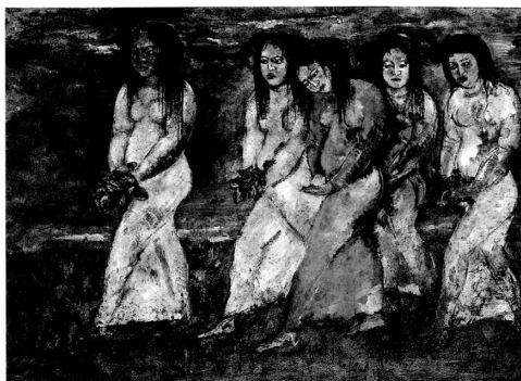
fig.2 関根正二《信仰の悲しみ》1918年、油彩、大原美術館