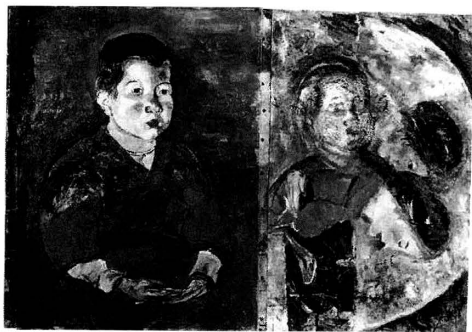
fig.6 《子供》と《三人の顔》の合成写真