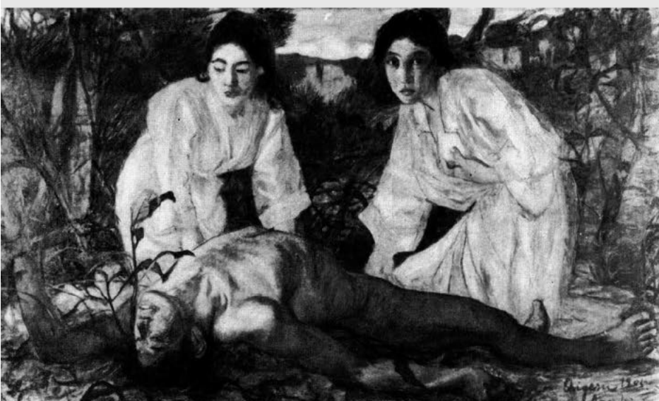
坂本繁二郎「帽子を持てる女」