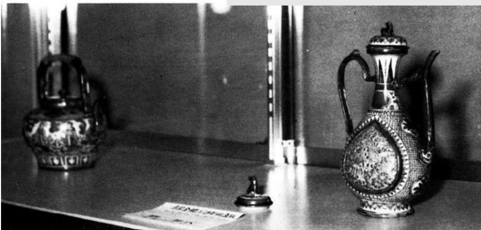
右より重文明赤絵金欄手透彫仙蓋瓶 赤絵金欄手水注